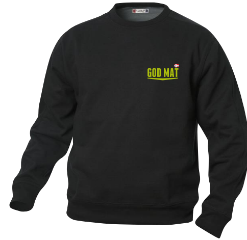
Clique Canton, klassisk college med rund hals. Brukes i sort eller hvit.