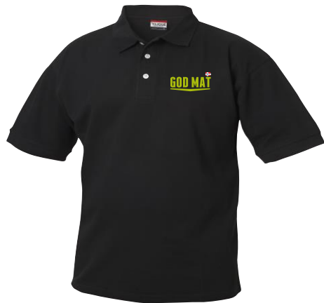
Clique Lincoln, klassisk Pique, herre. Brukes i sort eller hvit.