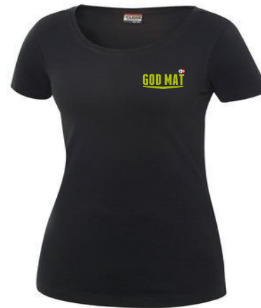
Clique Carolina, T-Skjorte kort arm Brukes i sort eller hvit.