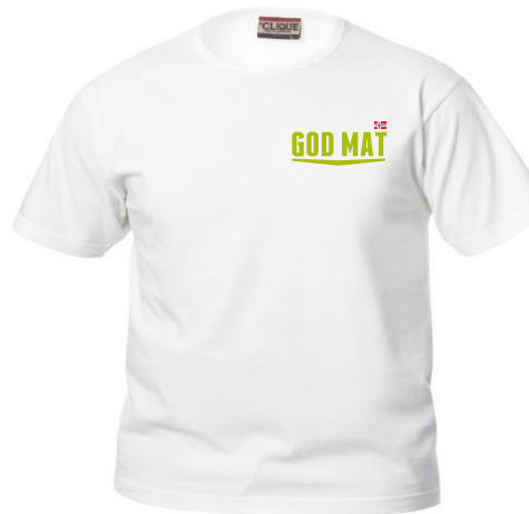
Clique Fashion T, Basic T skjorte Brukes i sort eller hvit.