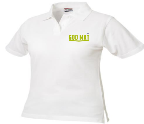
Clique Marion, Pique dame. Brukes i sort eller hvit.