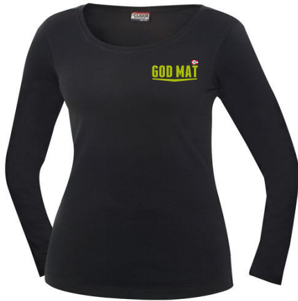
Clique Carolina, T-skjorte lang arm. Brukes i sort eller hvit.